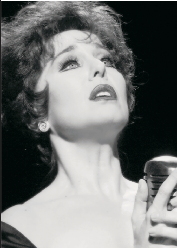
Judy Garland en...